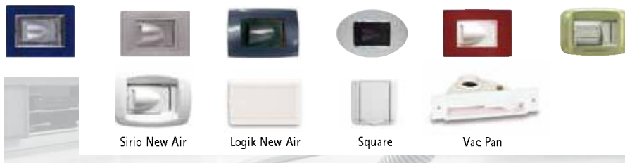
Sirio New Air

New Air socket body - Corps de prise New Air - Saugdosenkörper New Air - Cuerpo de toma New Air - Corpo de tomada New Air